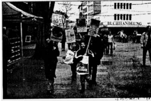
Der Selterweg war gestern Schauplatz der Demonstration.